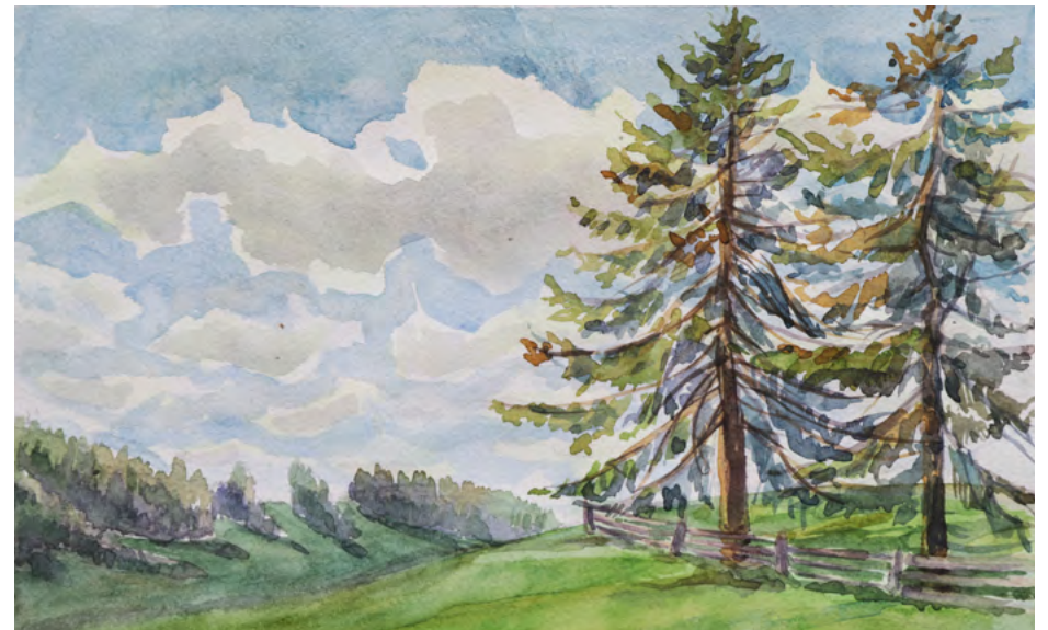
Ушакова Юлия / МБУ ДО «Двуреченская ДШИ» /