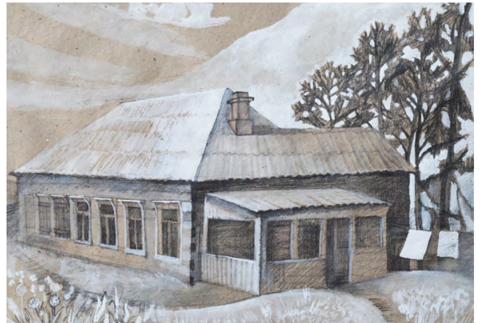
Белекеева Светлана / г. Новоуральск ДХШ /