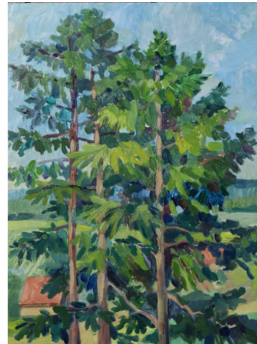
Гусева Наталия / г. Новоуральск ДХШ /