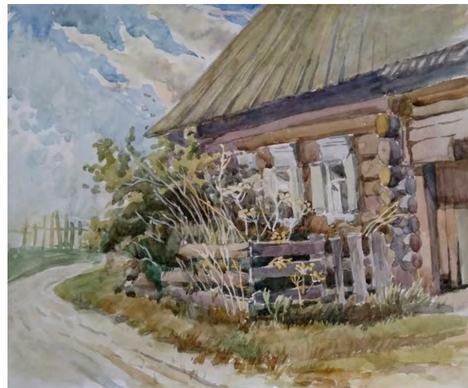
Дьячкова Наталья / г. Каменск-Уральский ДХШ № 1 /